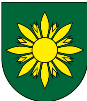
Príloha 1: erb obce